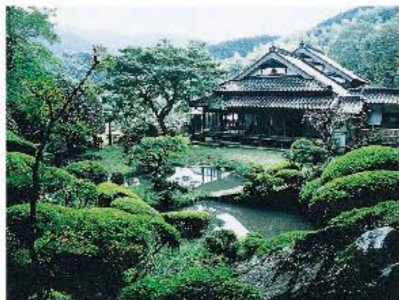
雪舟ゆかりの魚楽園