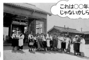
これは〇〇年ごろ じゃないかしら