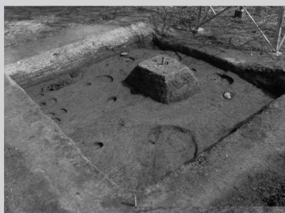
鎮西原遺跡の全容