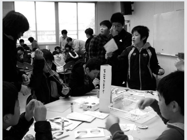
▲ 厚紙と糸でびゅんびゅんごまを作る