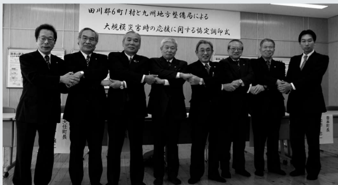
▲ 7町村と整備局の連携を図る