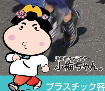
川崎町キャラクター 小梅ちゃん。

プラスチック容器は祝日も回収しています。ゴミは、回収日の朝8時30分までに出しましょう。