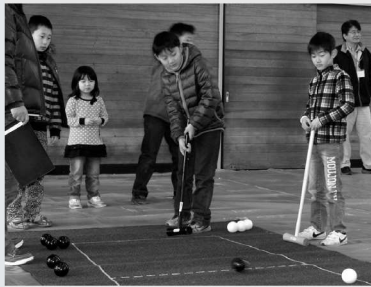
◀ 白と黒の球を打つ 囲碁ボール

コミュニティセンターで川崎町子ども会育成会連合会主催の「川崎町子どもまつり」が開催されました。約300人の親子連れが参加し、工作・スポーツコーナーは大盛況。子どもたちはプラバンキーホルダーや万華鏡を作ったり、囲碁ボールやミニボウリングなどの子どもから大人まで楽しめるニュースポーツ、液体窒素を使ったサイエンスショーを楽しんでいました。