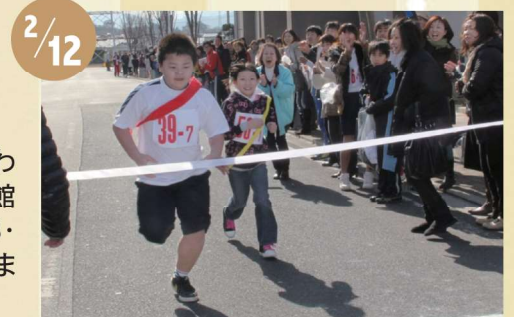
ゴール直前の接戦に観客も大興奮

寒空の下、町民駅伝大会が開催されました。町民会館前で開会式が行われ、小学生から一般まで、33チームがスタートラインに立ちました。町民会館前～上真崎コースの10kmを走り、最初にゴールしたチームは「絆・飯塚OB・葵」(オープン参加、33分43秒)でした。力を出し切った選手たちは、ふるまわれた豚汁を食べ、汗をかいて冷えた体をほっこり温めました。