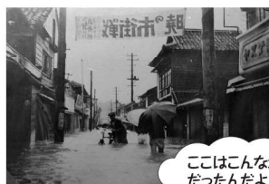
ここはこんな場所 だったんだよ

木造の建物、賑わう商店街、ボタ山…。 町が所蔵する写真の中には、いつどこで撮られたのかわからないものも存在します。 コメントを書き込むスペースも用意しますので、その写真にまつわる情報をぜひお寄せください。 日時は決まりしだい広報紙でお知らせします。