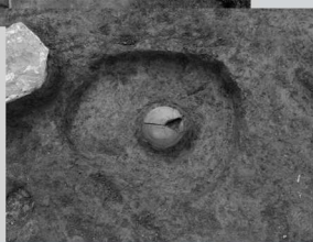
古墳時代のお墓から須恵器が出土

皆さん、こんにちは。かわさきワクワク発掘隊です。 今月は、鎮西原遺跡の紹介をしたいと思います。