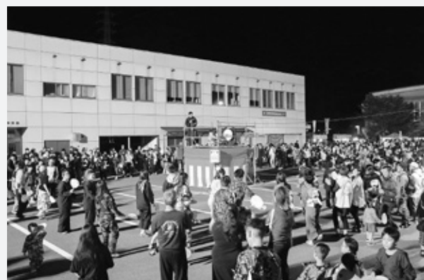
▲輪になってやぐらを囲む