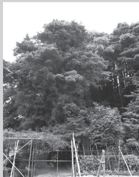
▲観音堂のクロガネモチ

皆さん、こんにちは。かわさきワクワク発掘隊です。さて、今月も内木城の観音堂内にある町指定天然記念物について紹介したいと思います。