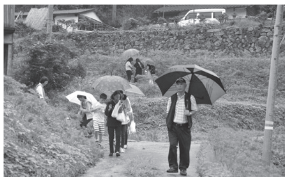
主催：以心田心川崎地域力活性化協議会

宝くじの助成金でテントや音響設備などを購入し、9月22日、小峠地区棚田彼岸花群生地周辺で「あたか棚田彼岸花まつり」を開催しました。 安宅の皆さんが地元を盛り上げることを目的として始め、今年で8回目を迎えた彼岸花まつり。地元の特産品を販売した模擬店やこだわりのコーヒーが飲める古民家カフェも大好評でした。今年も大勢の人に、安宅の自然とおもてなしを満喫していただきました。