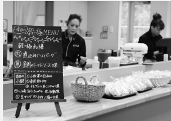
▲料理が並んでいたキッチン前では本日のメニューをご紹介します