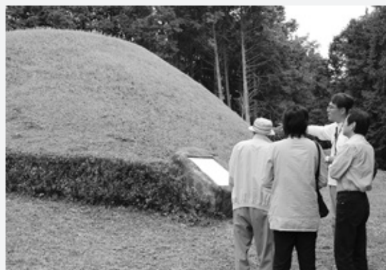
遺跡の構造について説明を受ける参加者▶

遠賀川流域の古墳・遺跡公開と合わせて、戸山原古墳の石室が公開されました。県内外から多くの人々が訪れ、学芸員による遺跡の構造や発見された経緯などの説明に熱心に耳を傾けていました。また、今回はヤマメの串焼きや火おこし体験、勾玉づくり体験などのワークショップも用意され、訪れた人は古代風のひとときを楽しみました。