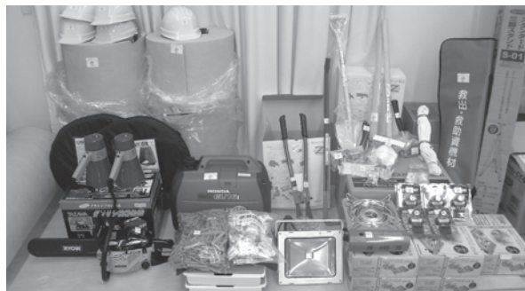
実施主体：櫛毛行政区自主防災会

今年10月に町内唯一の自主防災組織である櫛毛行政区自主防災会が、宝くじの助成金を受けて防災資機材・備品の整備を行いました。 地域における防災対策の要である「共助(隣近所で助け合うこと)」の活動を充実させることで、万が一災害が発生した場合に被害を最少限に抑えるため活用されます。 平常時では、地域の活動や訓練などで活用し、地域の防災力向上に役立てられます。