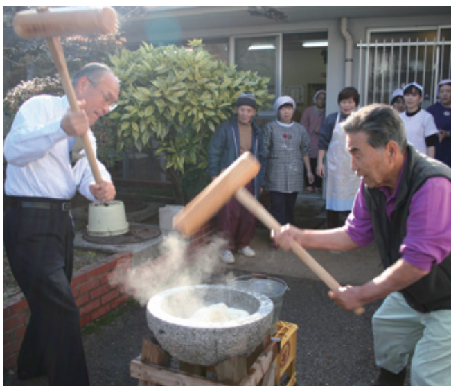
▲テンポよく、よいしょっ、よいしょ（愛光園にて）

12月26日、愛光園老人ホームで恒例の全日本同和会川崎連絡協議会による餅つき大会が行われました。今年も手際よく行われ、ポンポンとテンポよくつき上げ、周りからは賑やかな声援が飛び交っていました。つき上がったお餅を入所者も一緒に丸め、楽しいひと時を過ごしました。