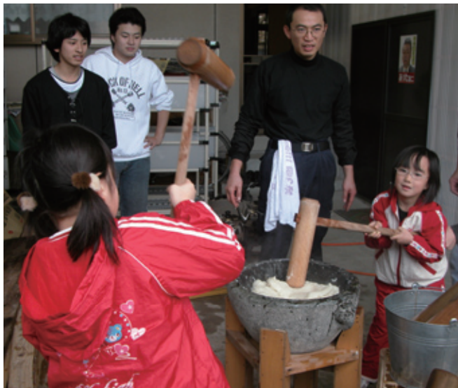
▲なかなか難しい～（中田原子ども会）

12月23日、中田原行政区子ども会による、餅つきが行われました。地区の家庭から頼まれたお餅を子ども会でついていました。途中合間を見ては、区内の施設にも出向いて行くなど大変な一日でした。地産地消ならぬ区産区消のもと、参加した親子は一生懸命になり、地域の行事に参加していました。薄れゆくコミュニティの昨今だからこそ、地域の頑張りに励まされました。