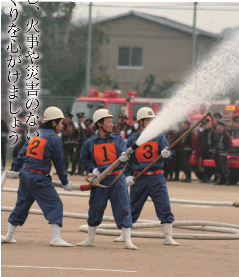
▲祝賀放水（ポンプ操法）