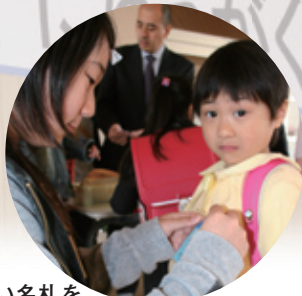
6年生に新しい名札をつけてもらい、ちょっとり恥ずかしい