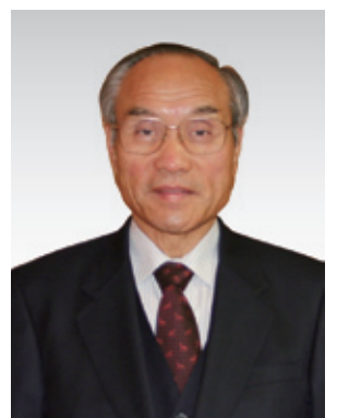
川崎町長 手嶋秀昭