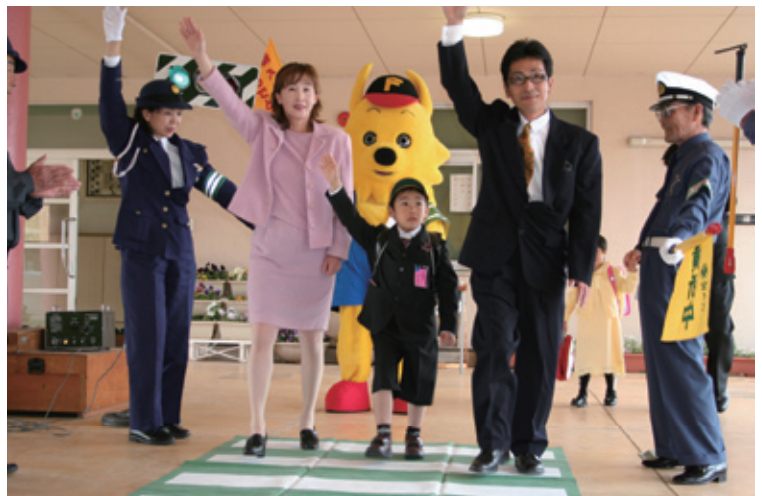
福岡県交通安全マスコットのマナップくんと警察署員の指導の下、川崎交通安全協会による交通安全指導が行われました