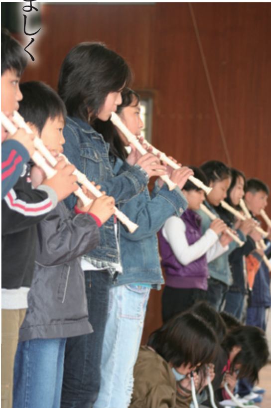
在校生（6年生）による、楽器演奏など