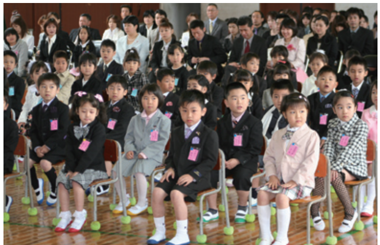
新しい仲間と一緒に