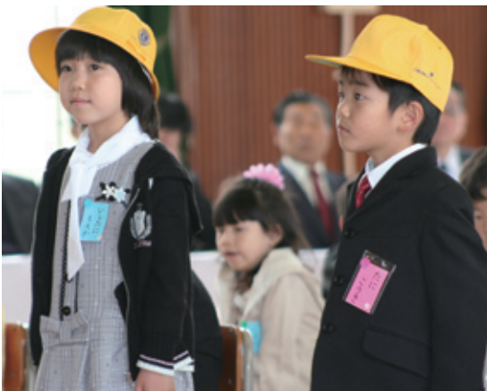
交通安全を願って川崎ライオンズクラブからは黄色の帽子、川崎交通安全協会からはランドセルカバーをそれぞれ寄贈されました