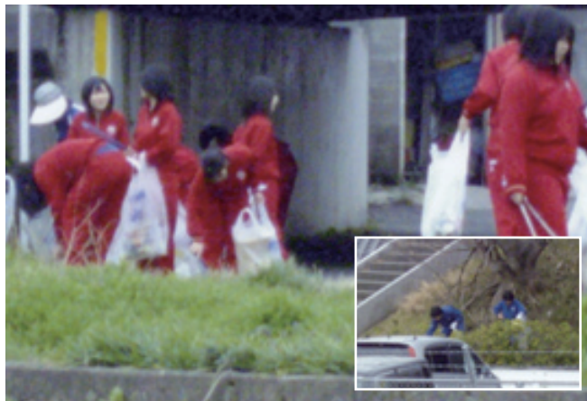
▲植え込みの中までゴミが

この姿を見ていた地元地域の人から、『頑張ってるね』のメッセージと写真の提供を頂きました。