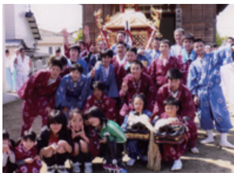
▲地域の人に見守られ伝統芸能の継承