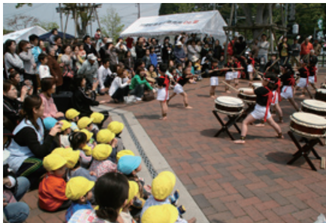
力強い園児の太鼓演奏▶

また、イベントに川崎保育園の園児による太鼓演奏もあり、たくさんの人でにぎわいました。