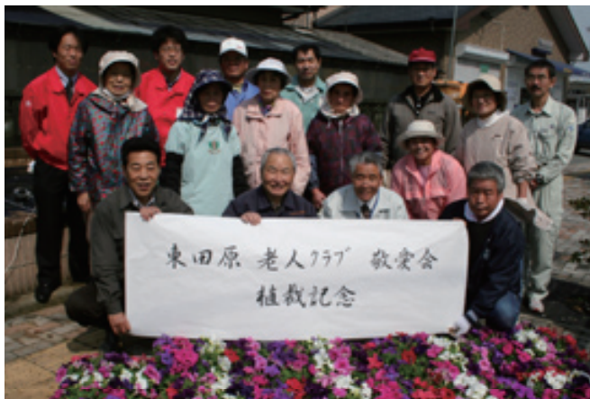
▲老人クラブ敬愛会のみなさん