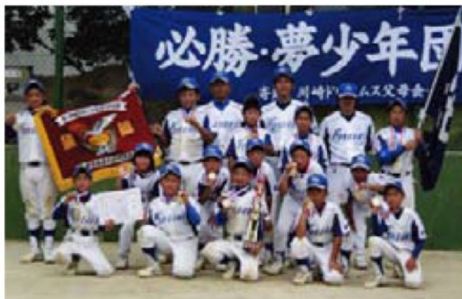
▲金メダルを手に、心も体も大きく成長した夏