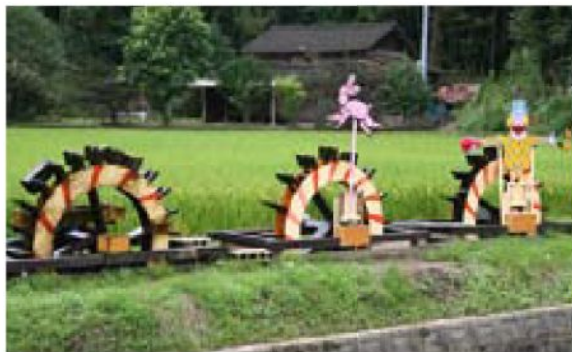
▲水車が回転するたびにピエロとウサギが動くよ

材木さんの仲間が、仕事の合間を見てはペンキ塗りをしたり、みんなで手づくりをして作られたそうです。ピエロが踊り、ウサギが駆ける様子は目を楽しませてくれます。