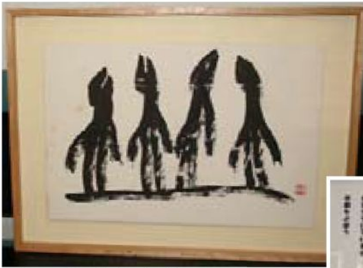
▲「ペンギン仲良し」の絵