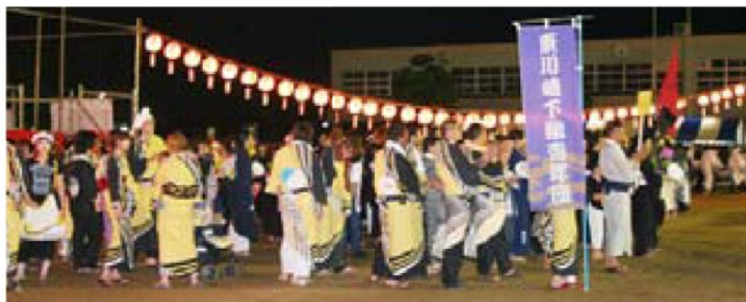
▲暑い夏の一夜となりました

8月23日、川崎町民盆踊り大会2008が開催されました。今年で2回目となるこの大会はカラオケ大会、浴衣美人コンテスト、豪華景品が当たる大抽選会なども行われ、たくさんの人でにぎわいました。