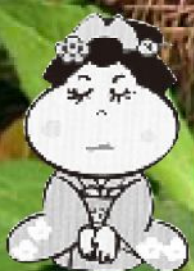
川崎町キャラクター 小梅ちゃん©