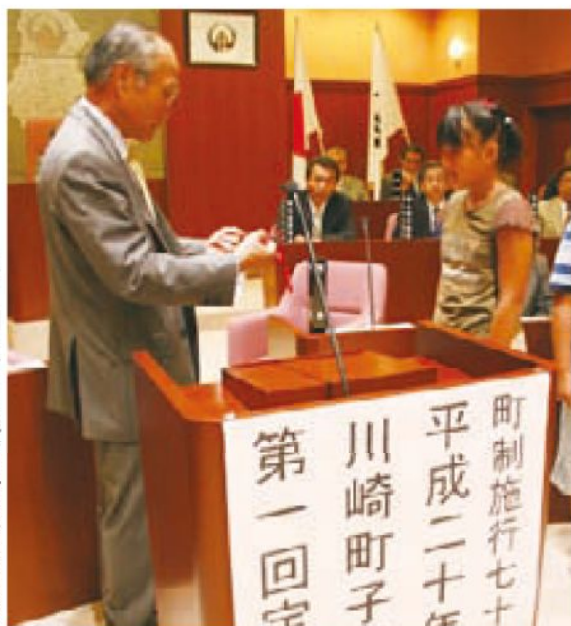
▶ 第一回の子とも議会、議員証交付の様子