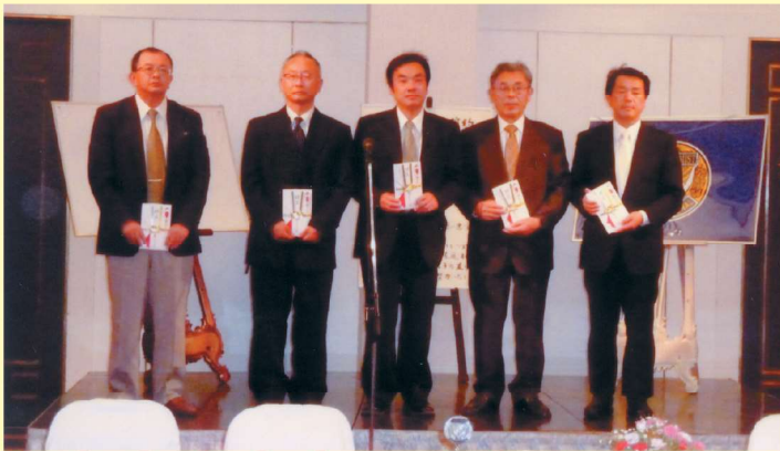
▲図書館にあたたかいご支援をありがとうございます