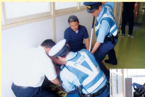
▲犯人役も警察官も本気