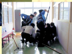
▲協力して犯人役を取り押さえる