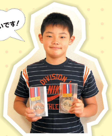
▲日ごろの努力のたまもの