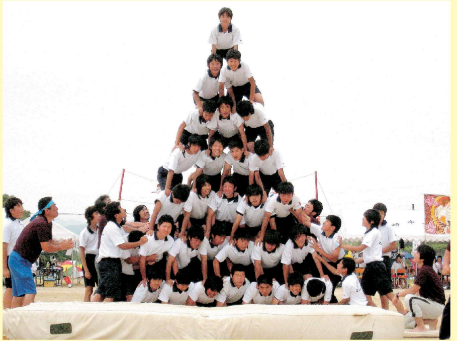
▲3年男子の7段ピラミッド

5月24日、川崎中学校の体育会で名物の3年女子6段ピラミッドと3年男子7段ピラミッドが今年も見事に成功しました。この日のために3年生は腕や足腰を鍛えるトレーニングを積みました。練習中はなかなか成功できず、本番でも一度目は失敗したものの、不屈の精神で再チャレンジ!見事男女とも立派なピラミッドを完成させることができました。