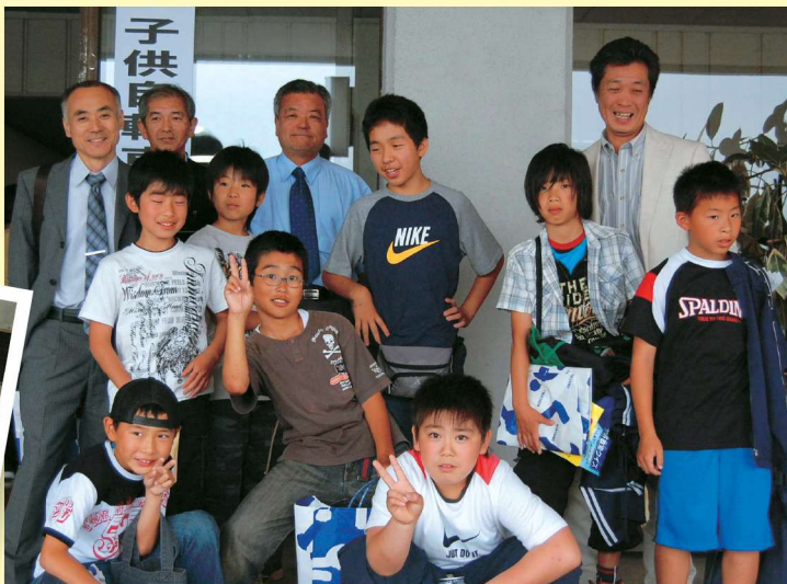
▲元気いっぱいがんばったよ