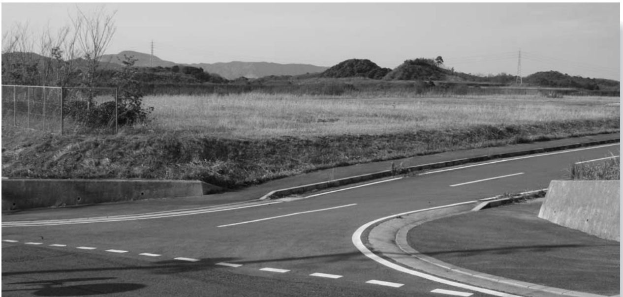
(工業用水道の早期着工で、企業誘致が期待される三井号四郎工業団地)

工業用水道が利用されるようになれば、川崎町の企業誘致政策において大変有利な条件が整いますので、新しく制定した条例の奨励措置（企業が進出しやすい措置）と合わせて、積極的に企業誘致に取り組んでいきたいと考えています。