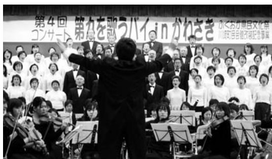
▲歌声も心もひとつになって