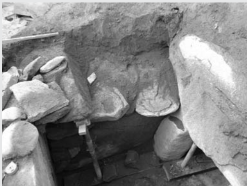
問詰に使用された粘土跡

発見された順番で、今回見つかった古墳は、近々「戸山原古墳3号墳」と命名される予定です。戸山原古墳群の解明に一歩近づいた調査であったと思います。戸山原古墳については、後日改めて報告します。