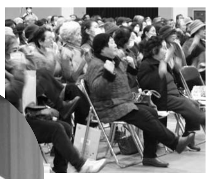
▲リズムにのせて手足を動かす