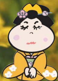
(川崎町キャラクター) 小梅ちゃん©