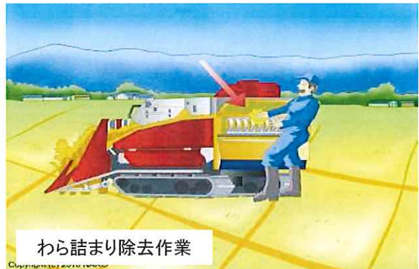
わら詰まり除去作業