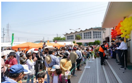
(昨年のかわさきパン博/会場写真)