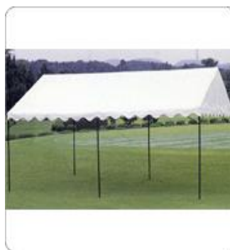
〈横幕を使用しない場合〉