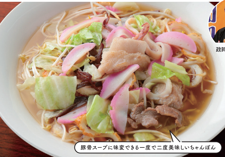
豚骨スープに味変できる一度で二度美味しいちゃんぽん