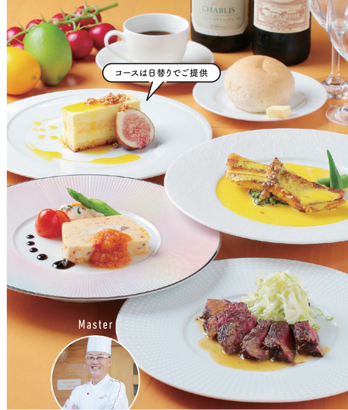
コースは日替りでご提供