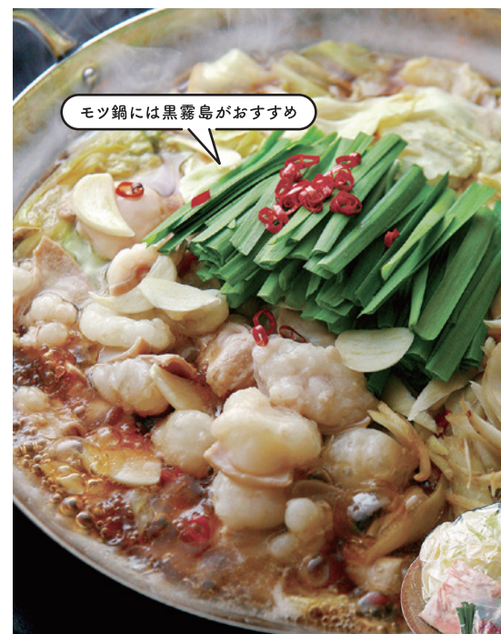
モツ鍋には黒霧島がおすすめ