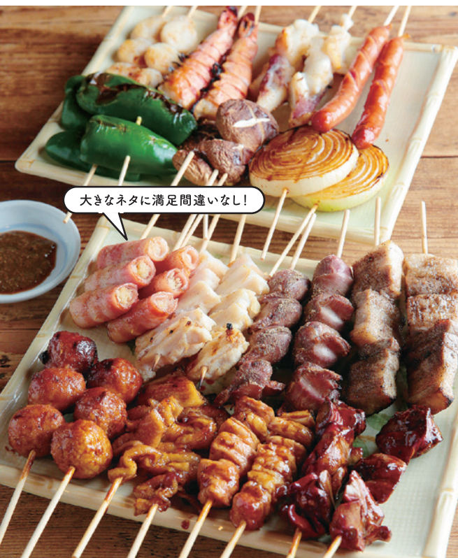
大きなネタに満足間違いなし!

100種類以上ある焼鳥の他にも、常連が飽きないようにと考案された珍味も実は人気。持帰りも行っているので自宅でも筑豊飯が味わえる。