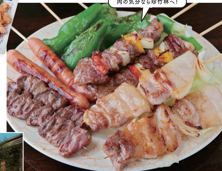
肉の気分なら珍竹林へ!

[メニュー] 焼き鳥10本セット ¥1,380、ステーキ ¥1,380、馬刺し ¥950、和牛のモツ鍋 ¥1,680、天むす(3個) ¥580