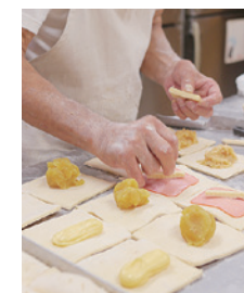
[メニュー(左上から)] ウイナーデニッシュ ¥150、 ピザ ¥150、きざらパン ¥150、 小倉あん ¥130、エビカツサンド ¥200 (全て税別)