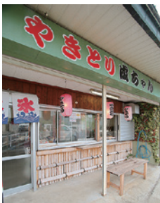
ドラッグストアコスモスの駐車場に隣接。町の人の憩いの場としても親しまれており、焼鳥の他にたこ焼きも販売中。