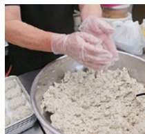
華丸コロッケ(1個¥150)は地方発送もOK。仕出しや惣菜・お弁当も豊富です。