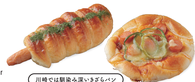
川崎では馴染み深いきざらパン