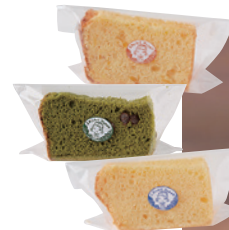
お菓子はすべてテイクアウト!