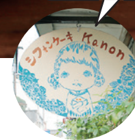
川崎の画家さんが作成!

シフォンケーキは、「バニラ¥130、ゆず¥140、あずき入り抹茶¥150」の3種類。ふるさと納税の返礼品としても人気!