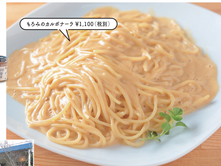
もろみのカルボナーラ ¥1,100 (税別)

果樹園の梨カレーや手作り窯で作るピザなども人気! 開放感あるガーデンテラスではバーベキューなども楽しめます。