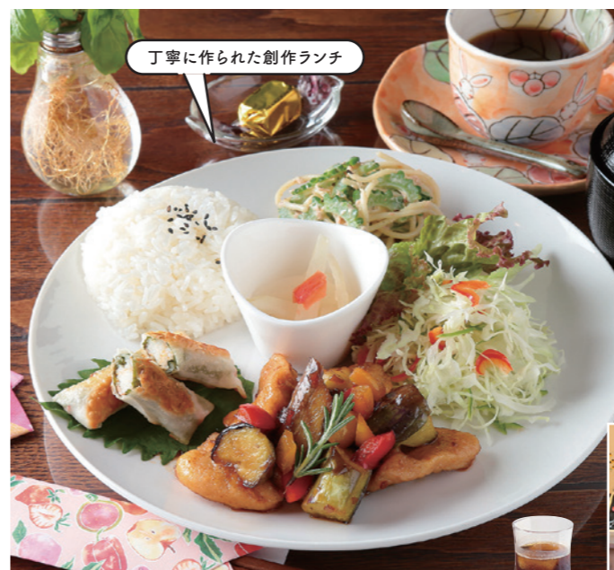
丁寧に作られた創作ランチ

【メニュー】日替りメニューのRYUENランチ ¥600、ドリンク付 ¥700、スパゲッティ(サラダ付) ¥500~、ケーキセット ¥450~