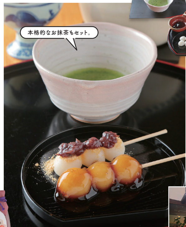
本格的なお抹茶もセット。