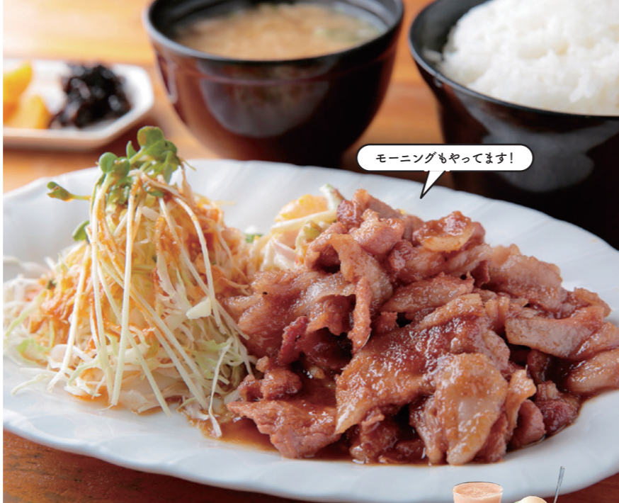
モーニングもやっています!