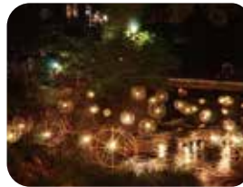
▲写真はイメージです