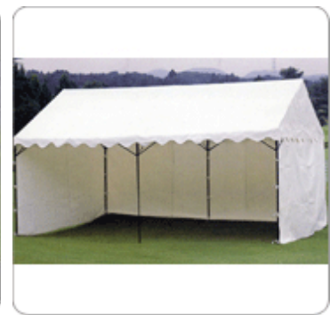
〈横幕を使用した場合〉