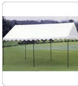
〈横幕を使用しない場合〉