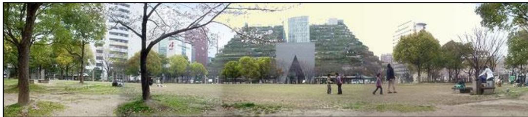
下:天神中央公園「ふくおか交流お祭りひろば」全景