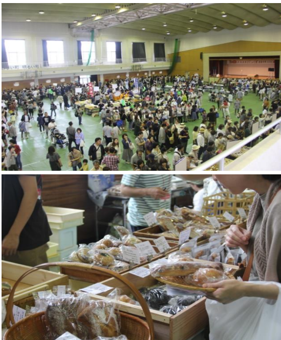
(2019年のかわさきパン博/会場写真)